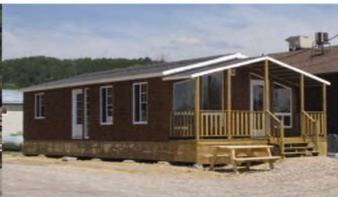
Ventanas panorámicas en opción