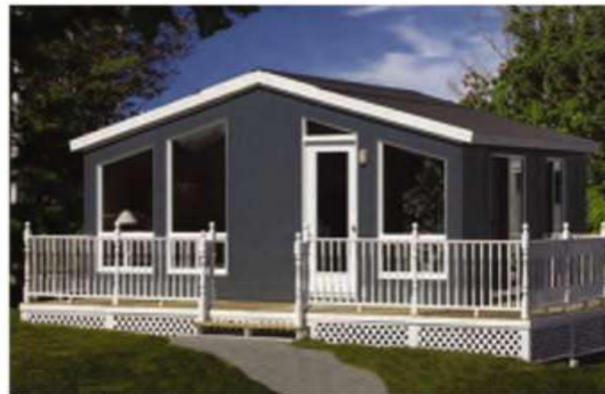
Ventanas panorámicas en opción