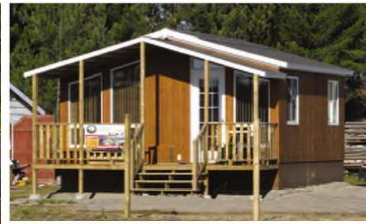
Ventanas panorámicas en opción