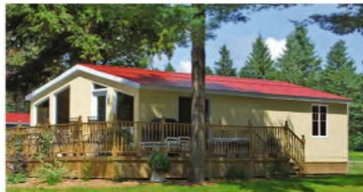
Ventanas panorámicas en opción